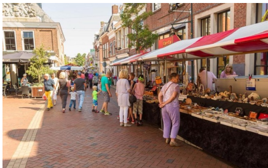
Voorbeeld van een markt met ouderwetse markt kramen

Nogmaals dit is een pilot, dus (nog) geen regelmatig terug kerende markt.