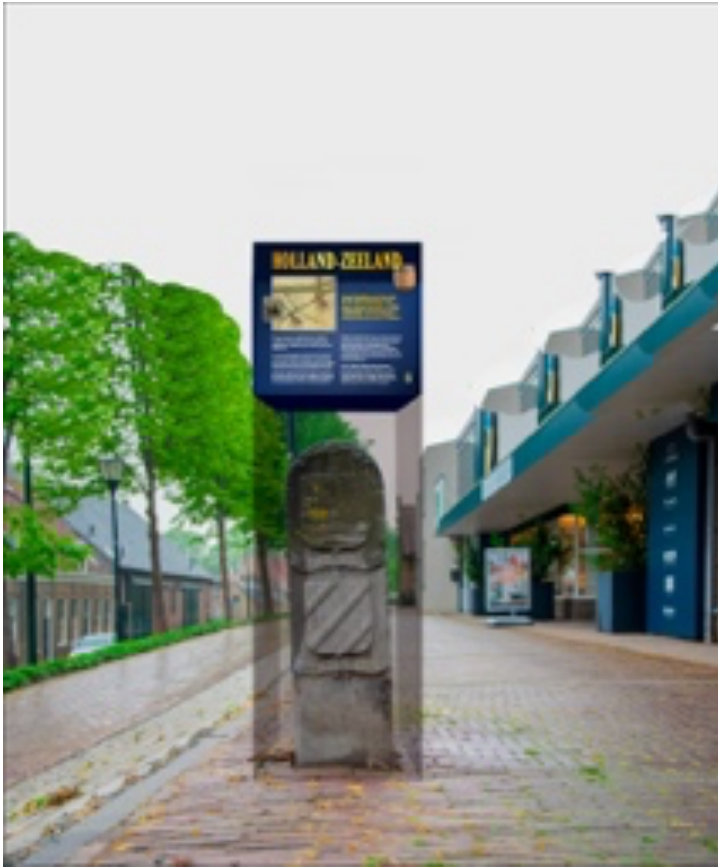
De nieuw onthulde grenspaal zuil met begeleidende tekst erop.