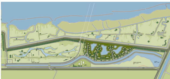
Het geplande gebied (de Noordrand) met de geplande huizen